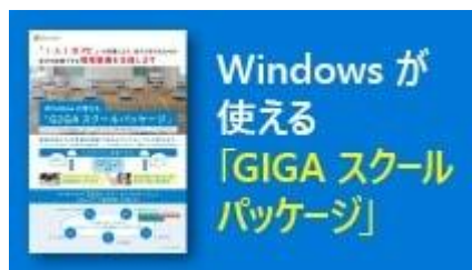
GIGA スクール構想ご案内パンフレット