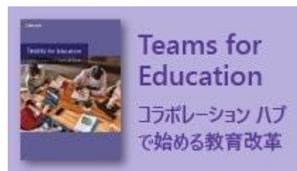
オンライン授業サポートアプリの使い方