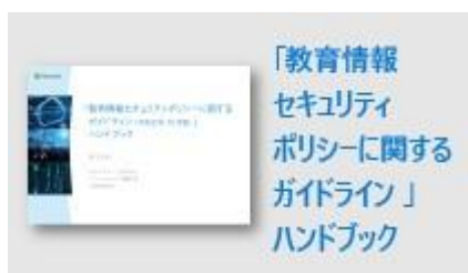
教育クラウドにおけるセキュリティ解説