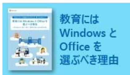
ICT 教育で重視すべきポイント解説